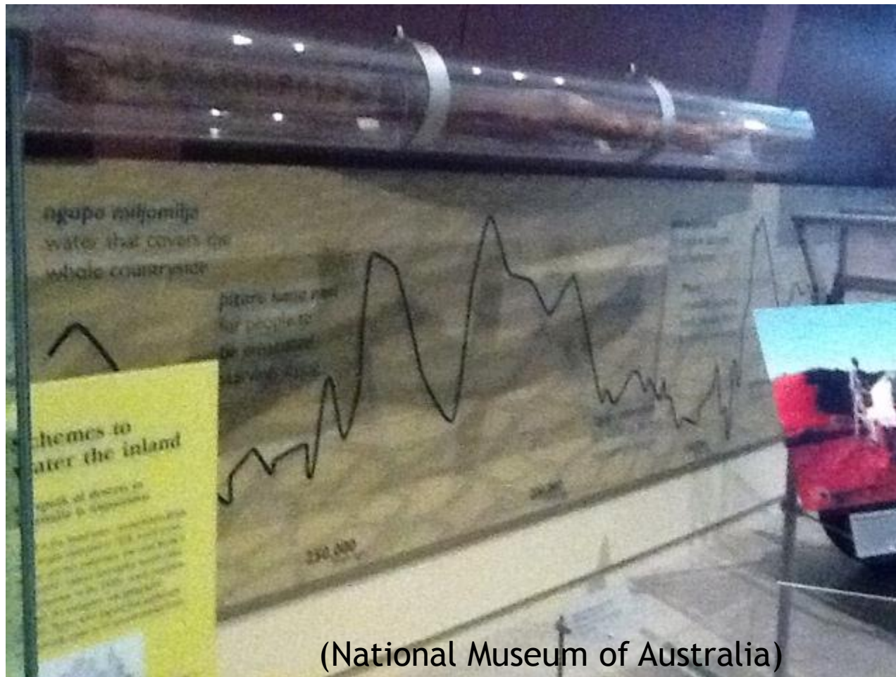
(National Museum of Australia)